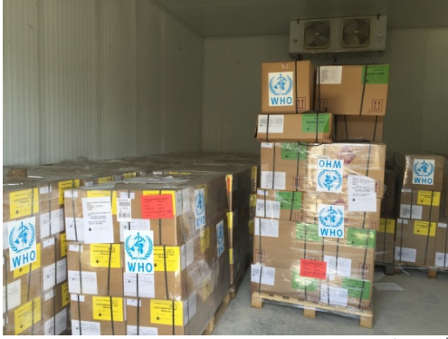
أدوية مُخزنة بالمؤسسة الليبية للتوريدات الطبية في طرابلس ليتم توزيعها على المستشفيات المختلفة في ليبيا