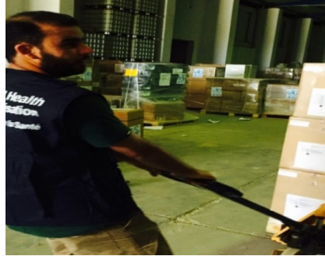
تخزين الإمدادات الطبية في مكتب طرابلس الطبي، ليبيا