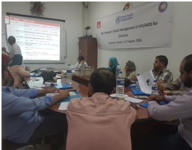
المشاركون يحضرون جلسة تدريب جماعي مع الاستشاري حول المعالجة الإكلينيكية لفيروس نقص المناعة البشرية (الإيدز) في مستشفى فطومة بورقيبة الجامعي بالمنستير، تونس.

في الأول من أغسطس/آب 2016، أجرى مكتب منظمة الصحة العالمية في ليبيا تدريباً طبياً لمدة 12 يوماً حول "المعالجة السريرية لفيروس نقص المناعة البشرية/الإيدز" للأطباء الإكلينكيين الليبيين في مستشفى فطومة بورقيبة الجامعي بالمنستير في تونس. وقد استهدف التدريب بناء قدرات الأطباء الإكلينكيين الليبيين في مجال العلاج المضاد للفيروسات الارتدادية والتوسع في استخدام العقاقير المضادة للفيروسات الارتدادية للوقاية من فيروس نقص المناعة البشرية في ليبيا. وجاء المشاركون في التدريب من أقسام مكافحة الأمراض المعدية من جميع أنحاء ليبيا. وتضمن التدريب الصفة الوبائية لفيروس نقص المناعة البشرية (الإيدز)، وطرق انتقال الفيروس، والمبادئ التوجيهية لمنظمة الصحة العالمية حول وقت البدء في العلاج المضاد للفيروسات الارتدادية، ووسائل الوقاية قبل التعرض لفيروس نقص المناعة البشرية (الإيدز)، وأول زيارة للأشخاص المصابين بفيروس نقص المناعة البشرية، وإعدادهم لتلقي العلاج المضاد للفيروسات الارتدادية، والتقييم السريري، والكشف الدوري والمتابعة، وعلاج العدوى بفيروس نقص المناعة البشرية والعدوى المصاحبة له، والالتزام بالبروتوكول العلاجي، ومنع انتقال الفيروس للمزيد من الأشخاص.