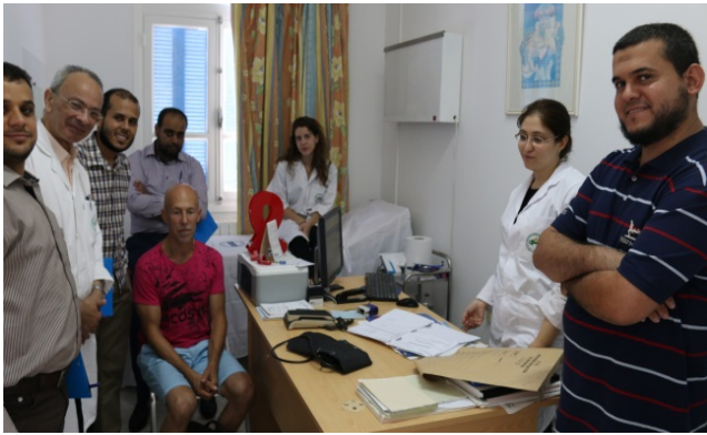
الأطباء يناقشون إدارة حالات فيروس نقص المناعة البشرية (الإيدز)، مستشفى فطومة بورقيبة الجامعي بالمنستير، تونس